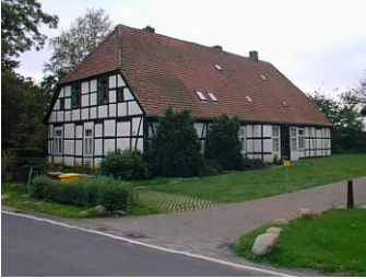
Vor dem Umbau 2003