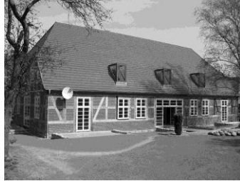
Nach dem Umbau 2007

Im Jahr 2010 wurde das Dach der Sakristei neu eingedeckt, es drohte einzustürzen.